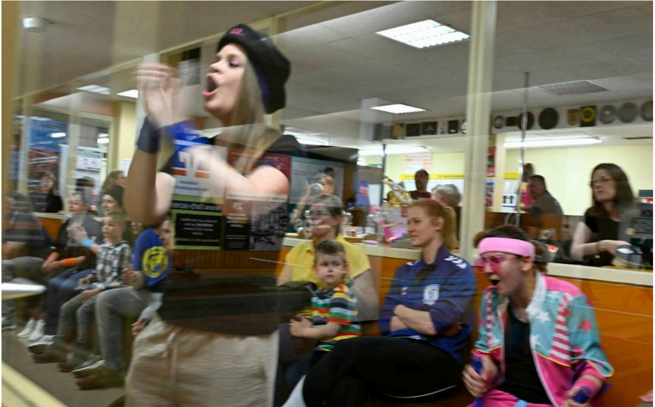
Laute Anfeuerung: Die Kegelhörner gelten als Partytruppe.

Mitspielerin zur Melodie des 1990er-Jahre-Songs „Freed from Desire“, der vor allem durch die Umdichtung „Will Grigg's on fire“ bei der Fußball-EM 2016 wieder populär wurde. Dieses Mal wird er zum Ohrwurm der Stadtmeisterschaft.