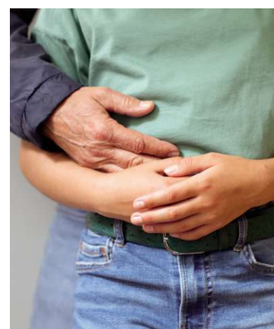
Die Bundesregierung hat eine „Unabhängige Kommission zur Aufarbeitung sexuellen Kindesmissbrauchs“ gegründet.